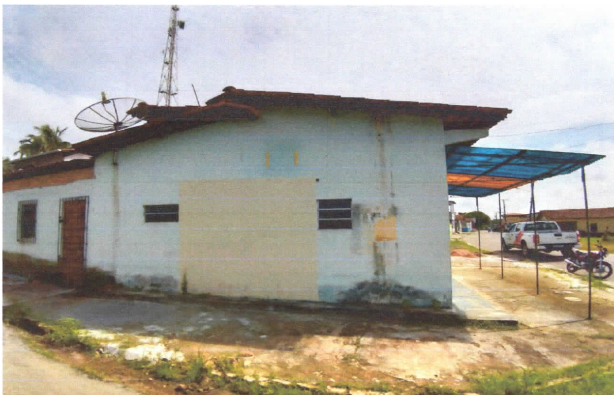
Foto 02: Fachada lateral da edificação, detalhe da pintura desgastada além de duas esquadrias em vidro e alumínio.