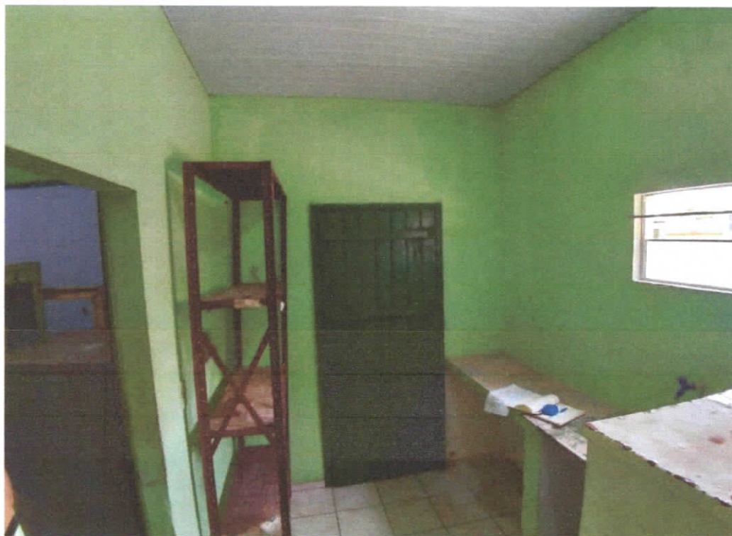
Foto 04: Copa/cozinha, detalhe da porta em réguas de madeira pintada na cor verde.