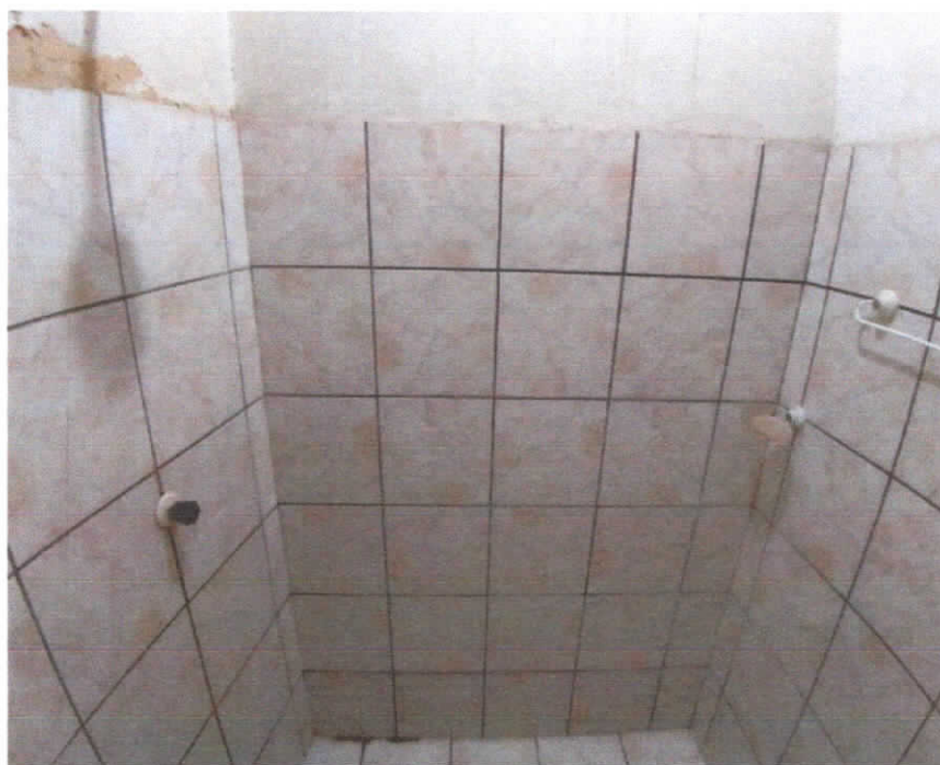
Foto 08: Banheiro, detalhes do revestimento cerâmico nas paredes.