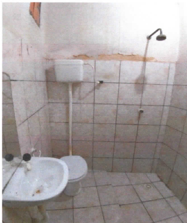
Foto 07: Banheiro, piso com revestimento cerâmico estampado, detalhe para louças e despredimento do revestimento superior da parede.