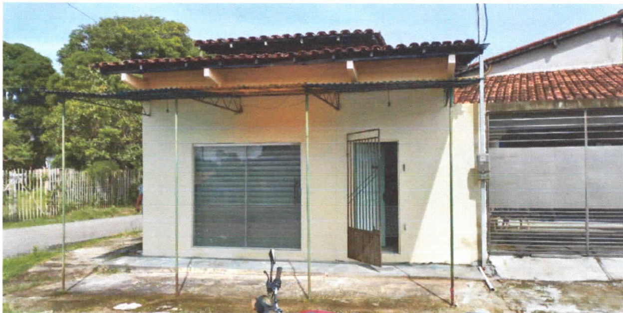
Foto 01: Fachada principal da edificação, acesso por porta de madeira gradeada, detalhe do toldo em estrutura metálica e porta de enrolar com porta de vidro duas folhas.