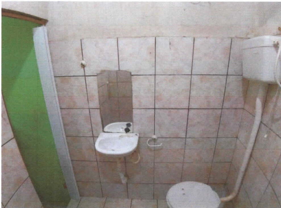
Foto 10: Banheiro, detalhes da pia, espelho e vaso com caixa suspensa.