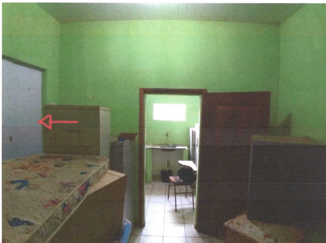
Foto 06: Sala 02, paredes pintadas e emassadas na cor verde, detalhe para parte em madeira maciça e divisória em PVC.

Rua Lauro Sodré, S/N – Centro, Magalhães Barata, Pará, CEP 68.722-000 E-mail: pmmagalhãesbarata.convenios@gmail.com