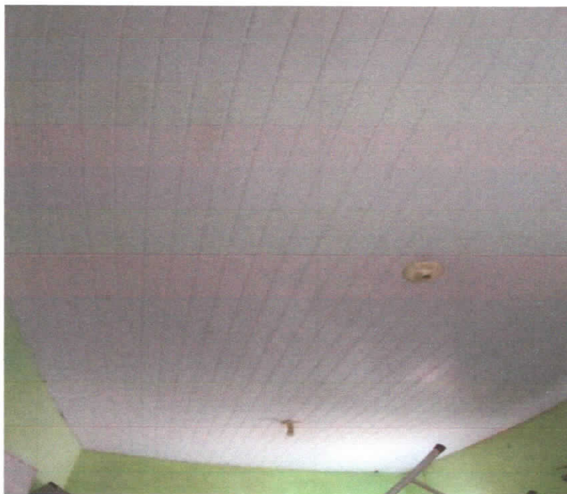
Foto 03: Sala 01, detalhe do forro em réguas de PVC e pontos de iluminação do tipo bocal com uma luminaria.