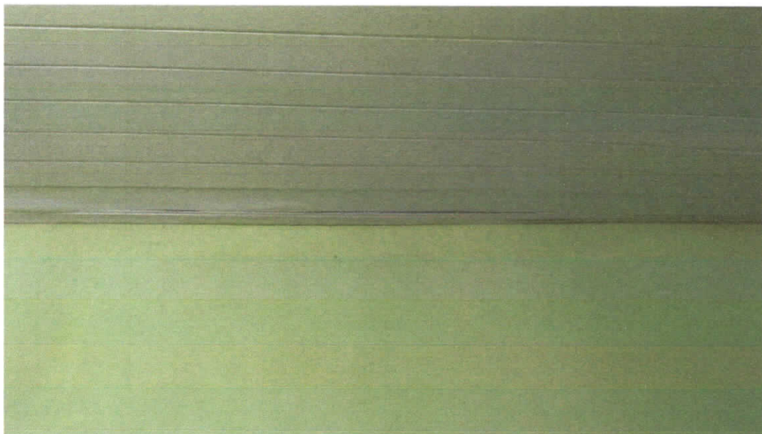
Foto 05: Sala 02, detalhe do ponto de afundamento das réguas do forro indicando descida d'água.