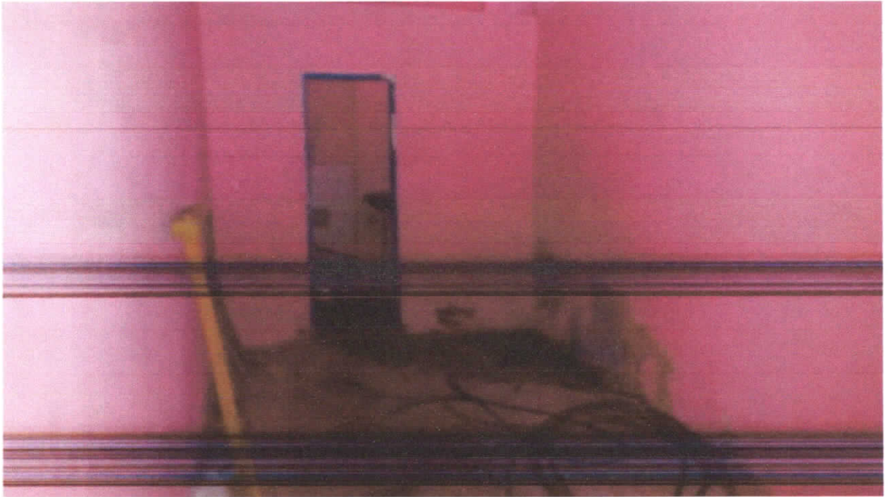
Foto 09: Sala, detalhe Para o piso sem revestimento, pontos de deslocamento da camada superficial das paredes e acesso ao banheiro.