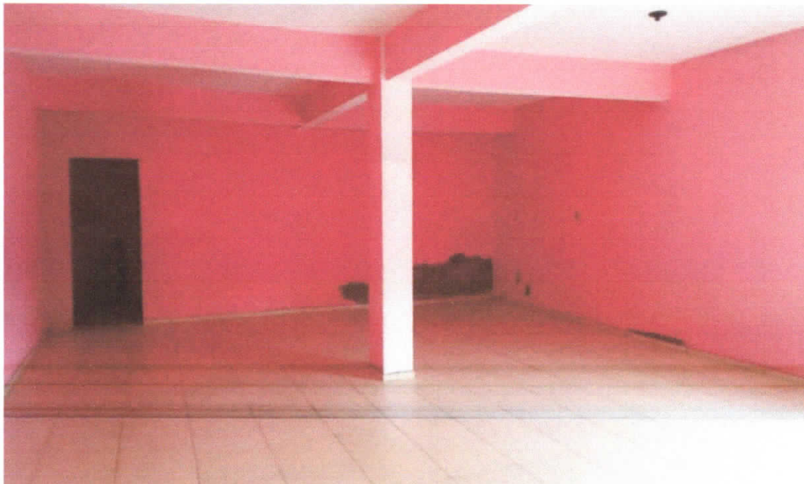
Foto 05: Almojarifado, piso cerâmico estampado 35x35cm, com cobertura em laje maciça, detalhe para os pontos de reboco expostos nas paredes.