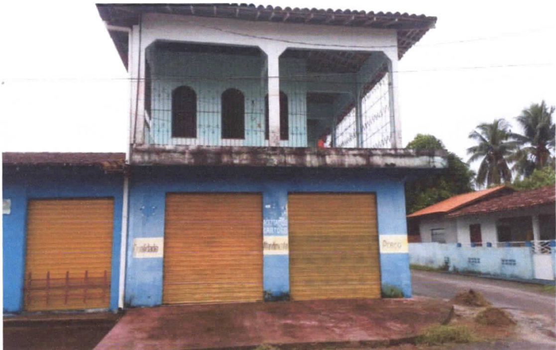
Foto 02: Fachada principal da edificação (Rua Lauro Sodré), detalhe das esquadrias em portas de enrolar, cobertura do pavimento térreo em laje maciça.