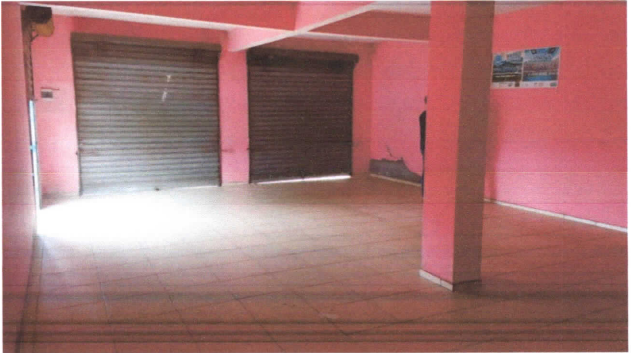
Foto 07: Almoxarifado, piso cerâmico estampado 35x35cm, detalhe para quadro geral e ponto na parede onde o reboco está exposto.