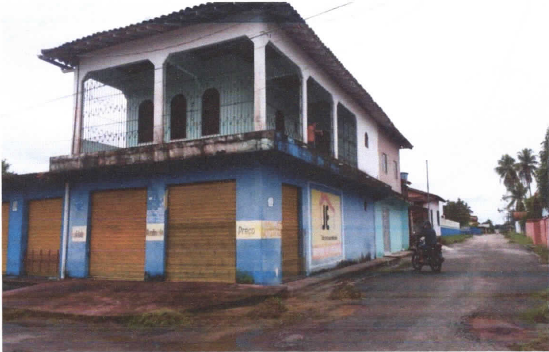
Foto 01: Fachada principal da edificação e lateral, paredes rebocadas e pintadas na cor azul, detalhe para as bases das paredes com infiltrações.