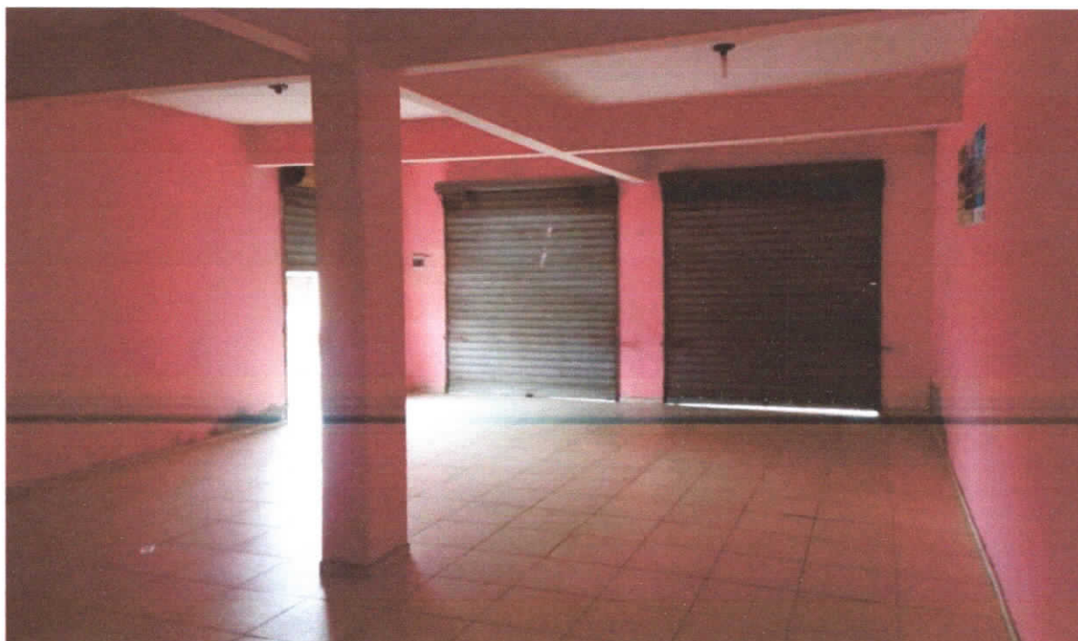
Foto 06: Almojarifado, piso cerâmico estampado 35x35cm, detalhe para as portas de enrolar que dão acesso a área externa da edificação.