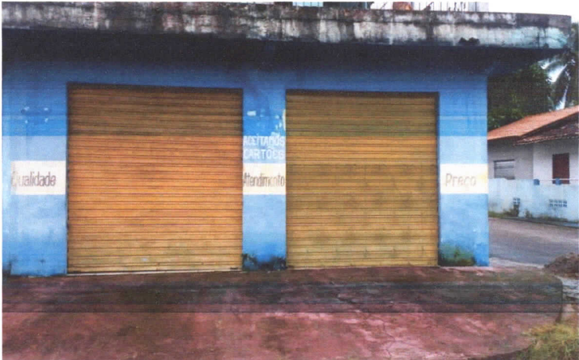
Foto 03: Fachada principal da edificação (Rua Lauro Sodré), paredes rebocadas e pintadas na cor azul, detalhe para as bases das paredes com infiltrações e calçada de acesso.