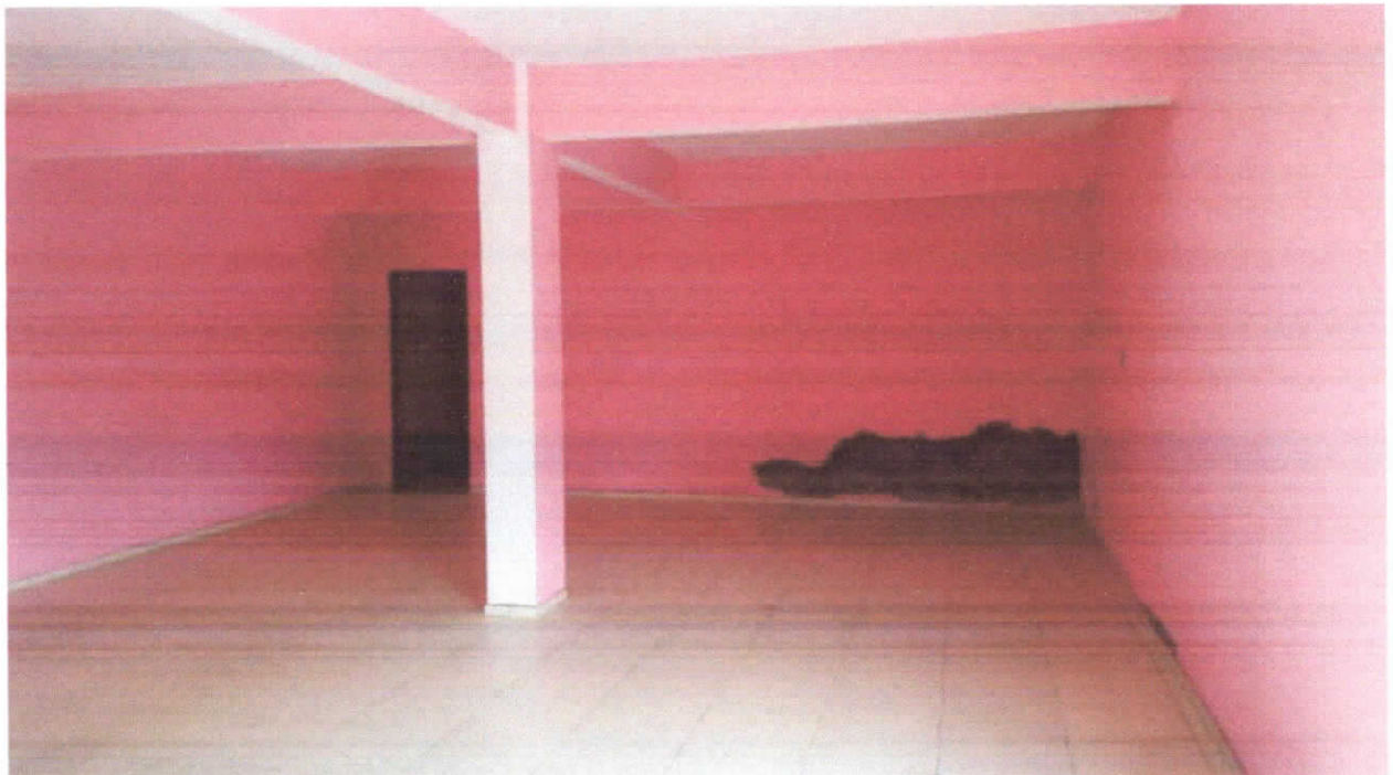
Foto 08: Almoxarifado, piso cerâmico estampado 35x35cm, detalhe para ponto na parede onde o reboco está exposto.