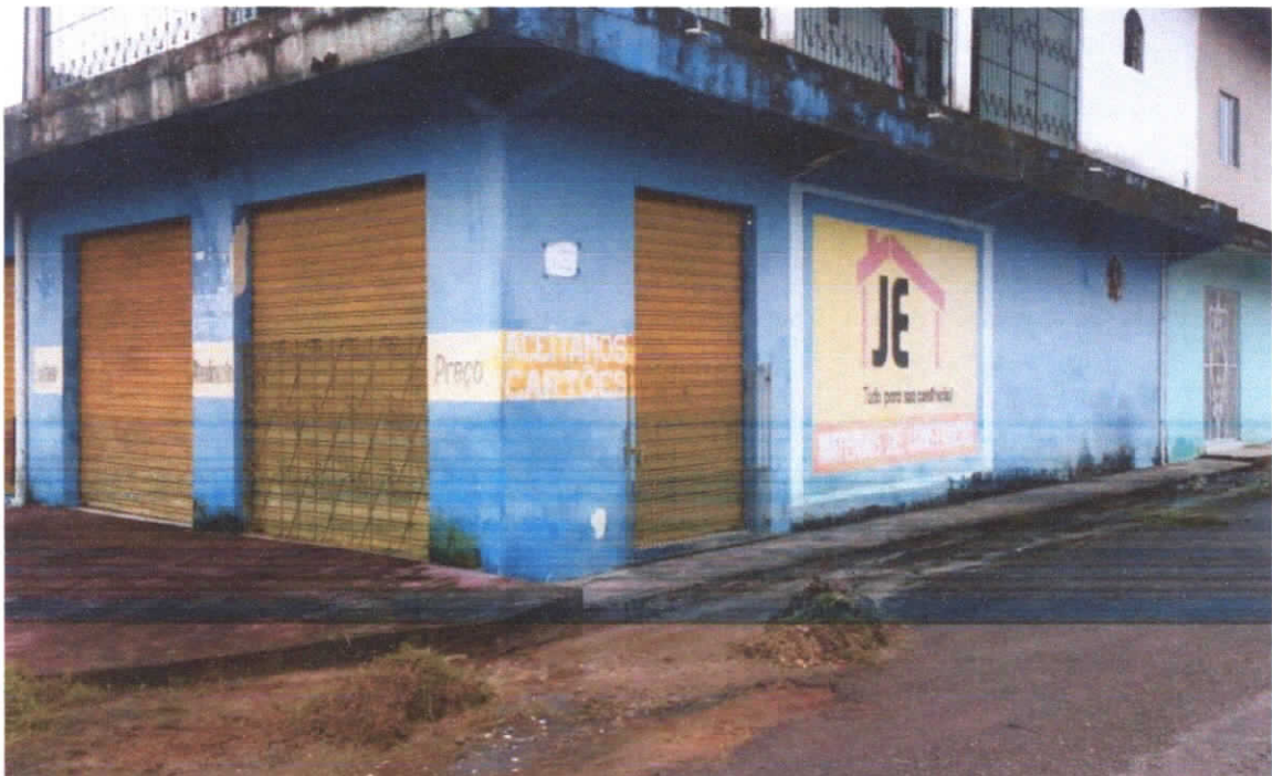
Foto 04: Fachada principal (Rua Lauro Sodré) e lateral da edificação (Rua Gatuliano Silva), detalhe dos acessos.